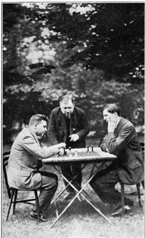
Een schaakpartijtje in de tuin; Réti (links) – Euwe (rechts), in het midden staat 'Wats' (Schelfhout).

ca, Rubinstein en Aljechin, die allen wel eens bij hem thuis logeerden en waarvoor hij een speciaal praalbed had.