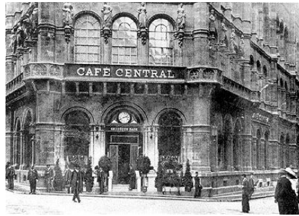
Café Central in Wenen omstreeks 1910.

Hij doorloopt het gymnasium en begint een studie wiskunde aan de Universiteit van Wenen. Daarmee wil het niet erg vlotten en hij is vaker in Café Central te vinden dan op de universiteit.