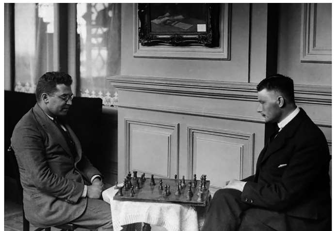
Max Euwe en Richard Réti in het Kurhaus in Scheveningen in 1923.

De opvattingen van Tarrasch hebben volgens Réti op de ontwikkeling van het schaken in Duitsland en Nederland een remmende werking gehad. Dit in tegenstelling tot Wenen waar het creatieve koffiehuis-schaak van Café Central wél veel sterke schakers heeft voortgebracht. Een aantal hen, zoals Tartakower en Nimzowitsch worden later met Réti de vertegenwoordigers van de 'Hypermoderne Schachschule'.