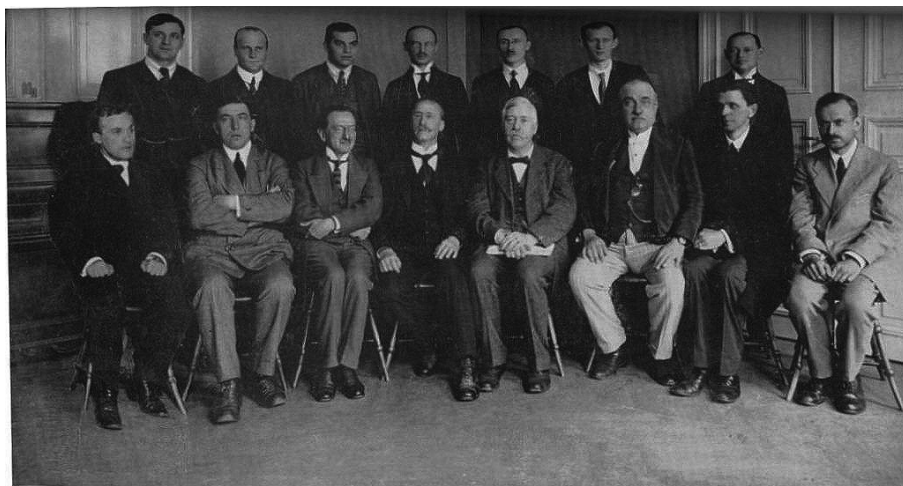
Deelnemers toernooi Gothenburg 1920: Réti staand derde van links en Tarrasch zittend derde van links.

Réti en Euwe reizen beiden af naar Zweden. De Hongaar staat ingeschreven voor de hoofdgroep en Euwe voor de B-groep. Als alle deelnemers al in Gotenburg zijn, doet zich een incident voor. Een van de deelnemers aan de hoofdgroep dient op de avond voor het begin van het toernooi een officiële klacht in bij het organisatiecomité.